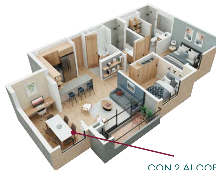
CON 2 ALCOBAS Y SALA COMEDOR