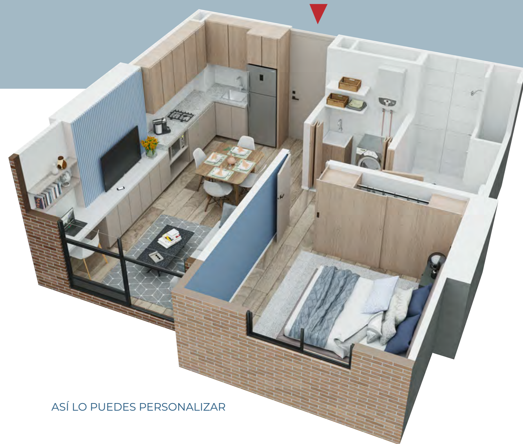
ASÍ LO PUEDES PERSONALIZAR