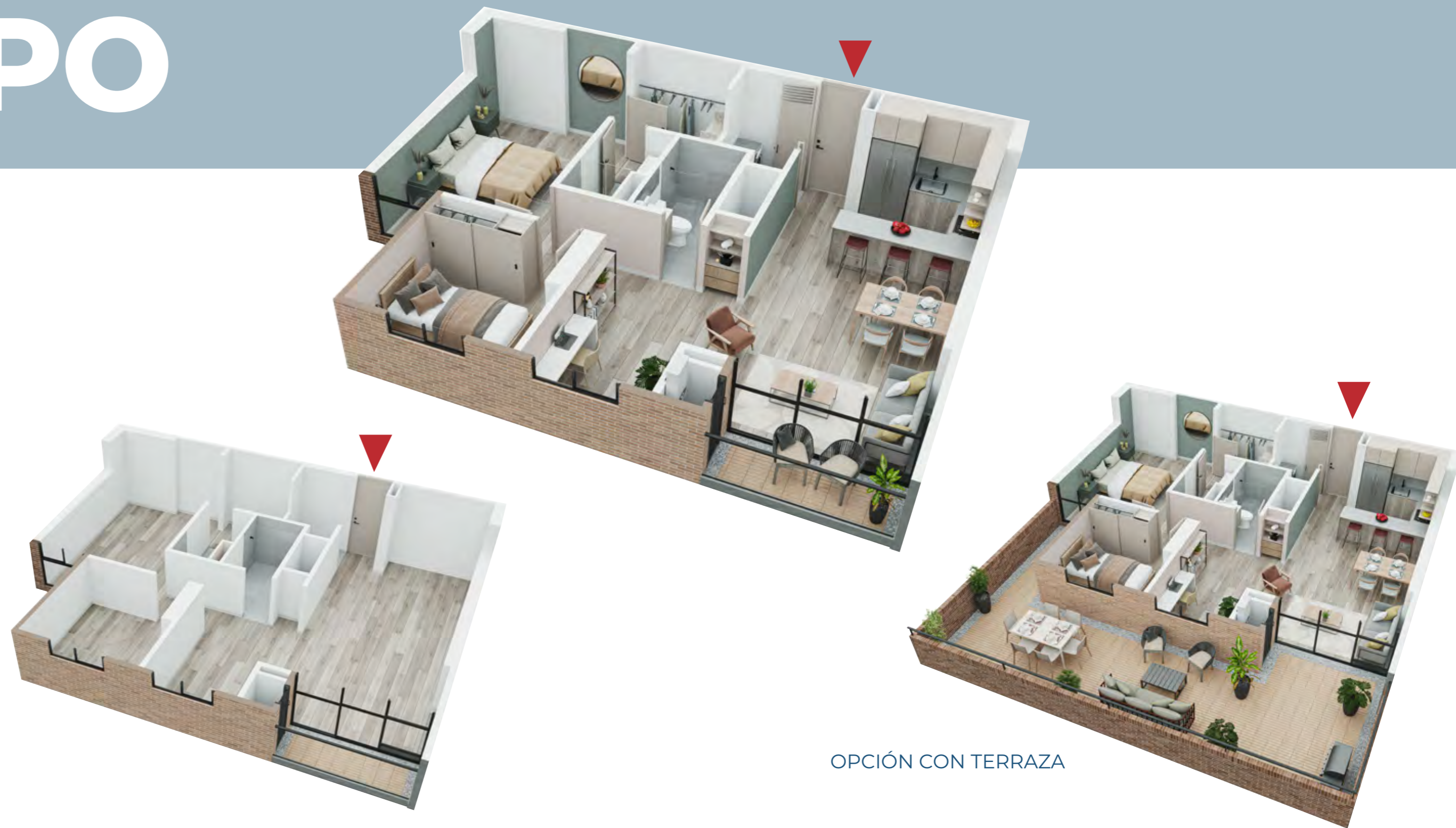
OPCIÓN CON TERRAZA