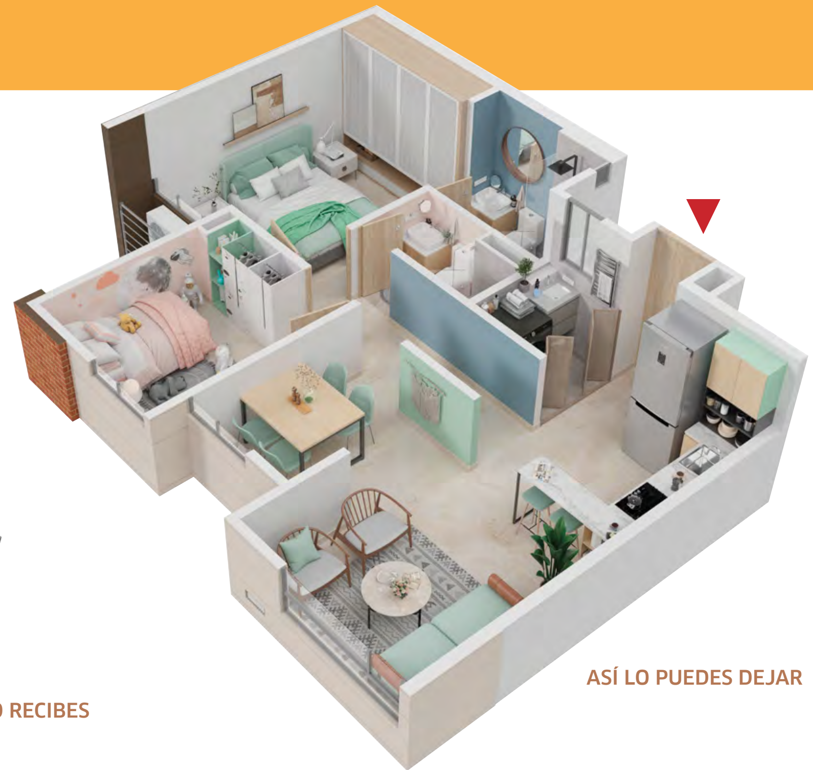
ASÍ LO PUEDES DEJAR