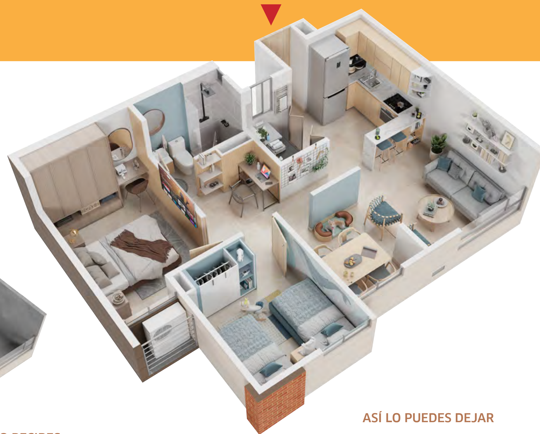
ASÍ LO PUEDES DEJAR