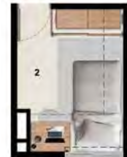
2. Opción Alcoba