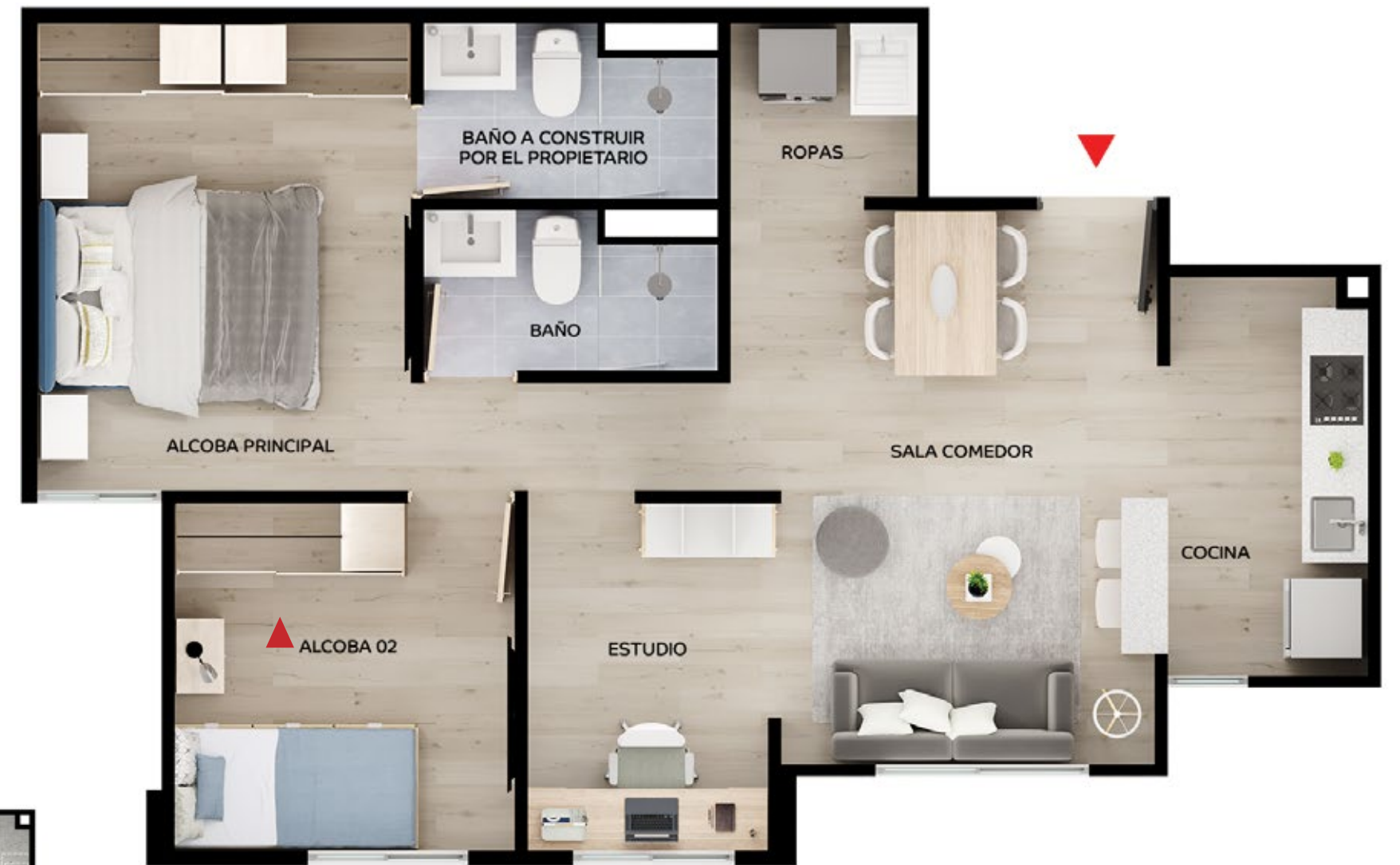
ASÍ LO PUEDES DEJAR