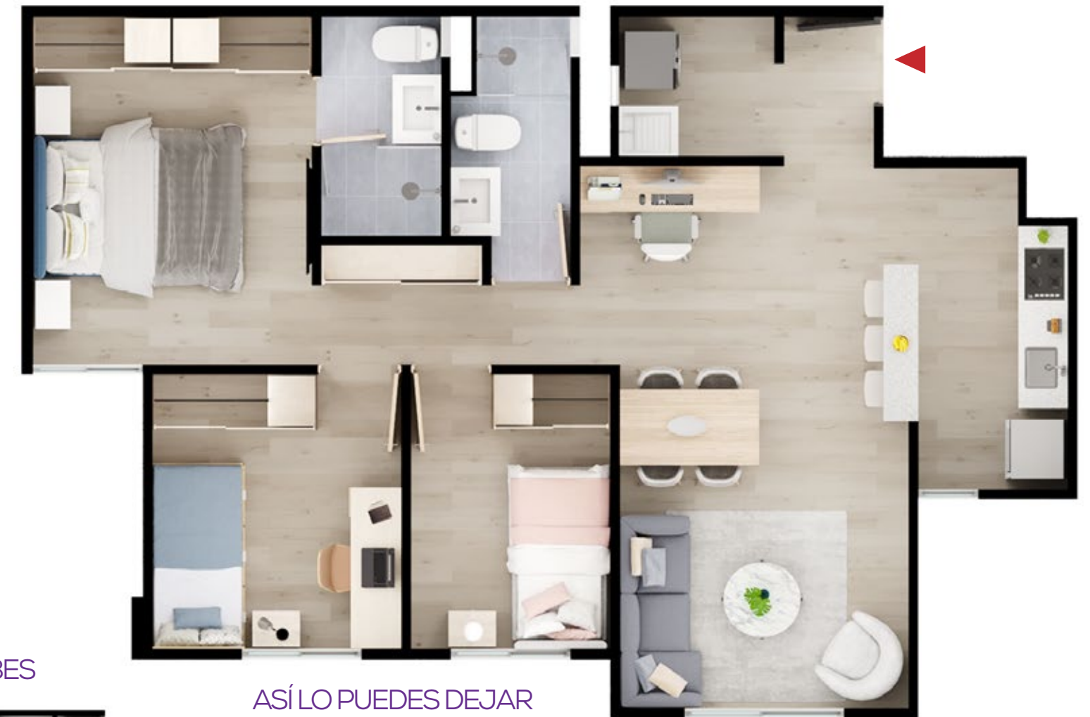
ASÍ LO RECIBES