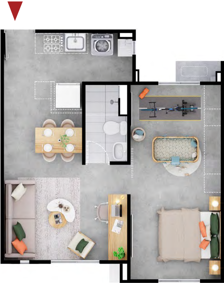
ASÍ LO RECIBES