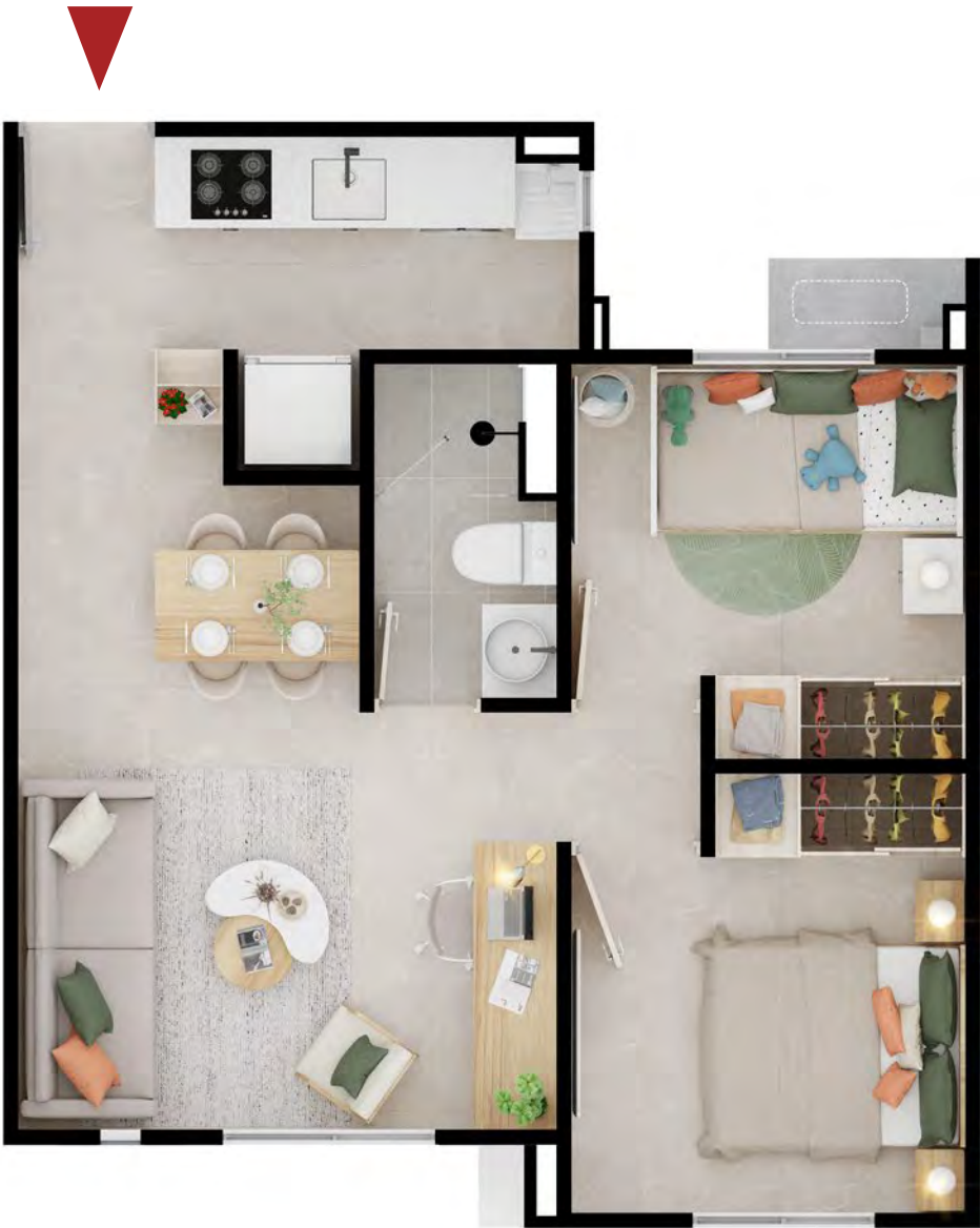
ASÍ LO PUEDES DEJAR

• LOS ESPACIOS PUNTEADOS CORRESPONDEN A ELEMENTOS QUE PUEDEN SER INSTALADOS EN EL APARTAMENTO PERO NO HACEN PARTE DEL MISMO.