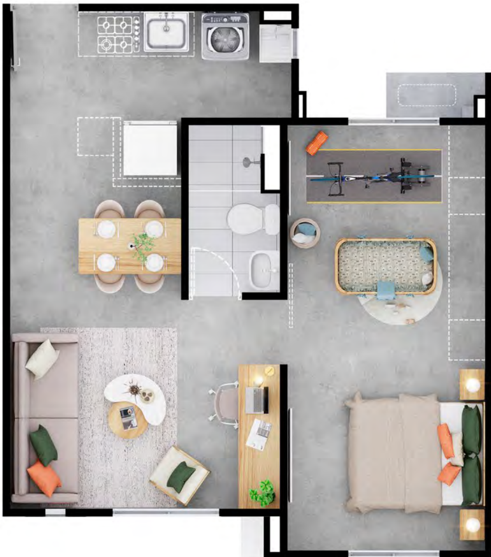
ASÍ LO RECIBES