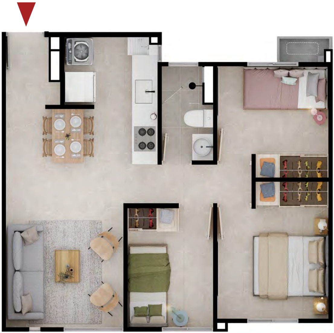
ASÍ LO PUEDES DEJAR

• LOS ESPACIOS PUNTEADOS CORRESPONDEN A ELEMENTOS QUE PUEDEN SER INSTALADOS EN EL APARTAMENTO PERO NO HACEN PARTE DEL MISMO.