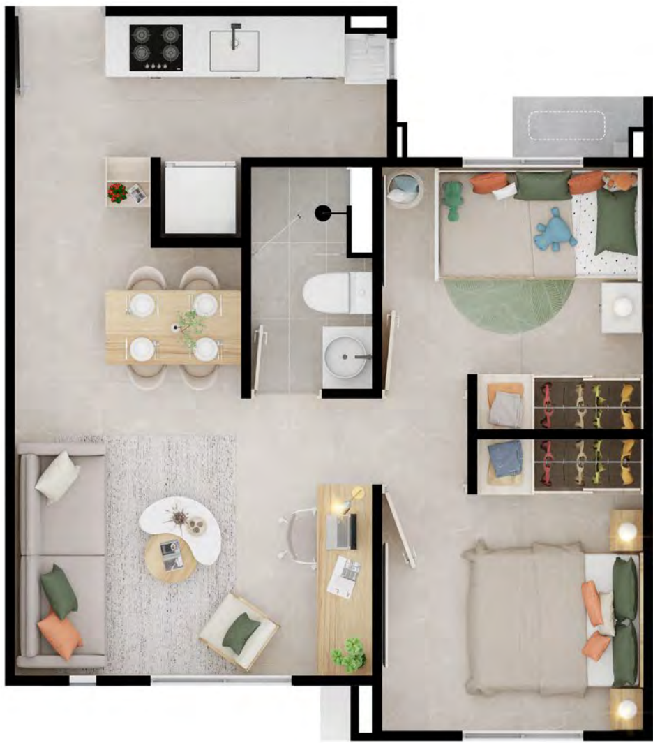
ASÍ LO PUEDES DEJAR

• LOS ESPACIOS PUNTEADOS CORRESPONDEN A ELEMENTOS QUE PUEDEN SER INSTALADOS EN EL APARTAMENTO PERO NO HACEN PARTE DEL MISMO.